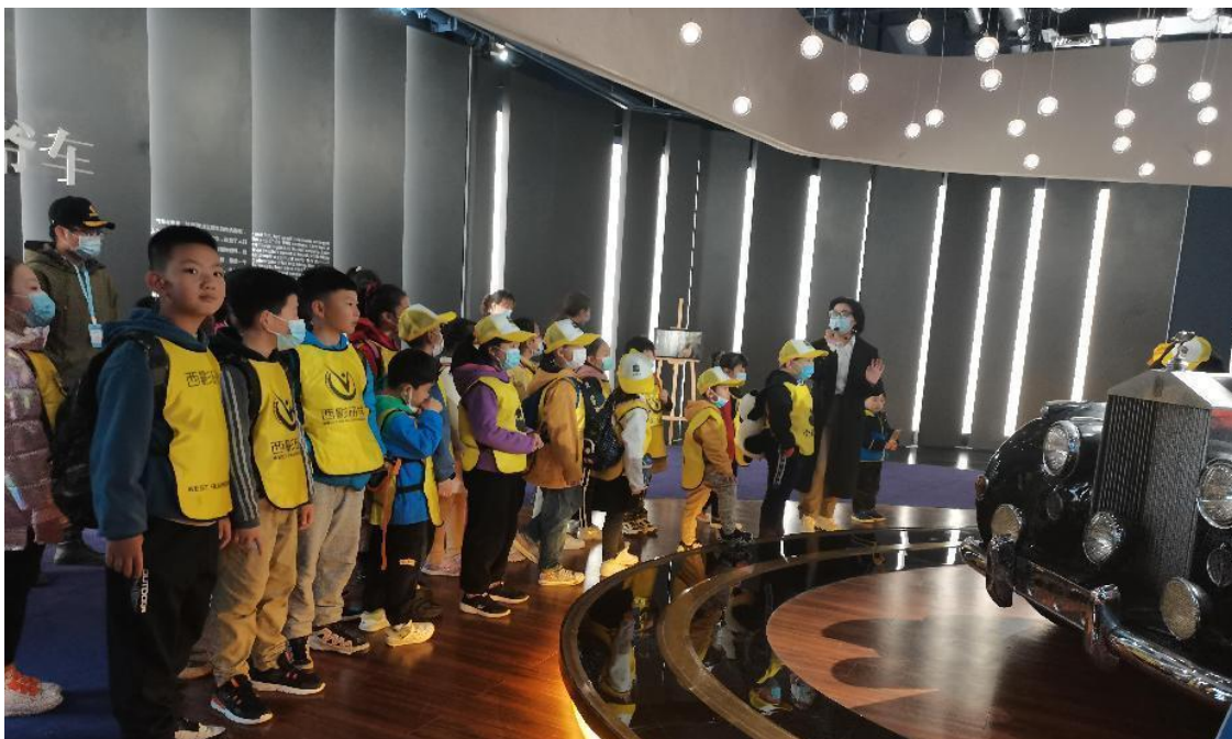
◎ 研点三：博物馆写生